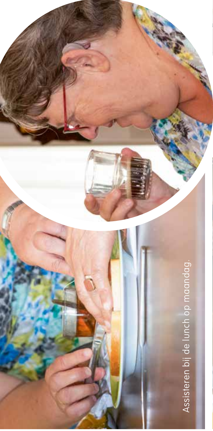
Assisteren bij de lunch op maandag.