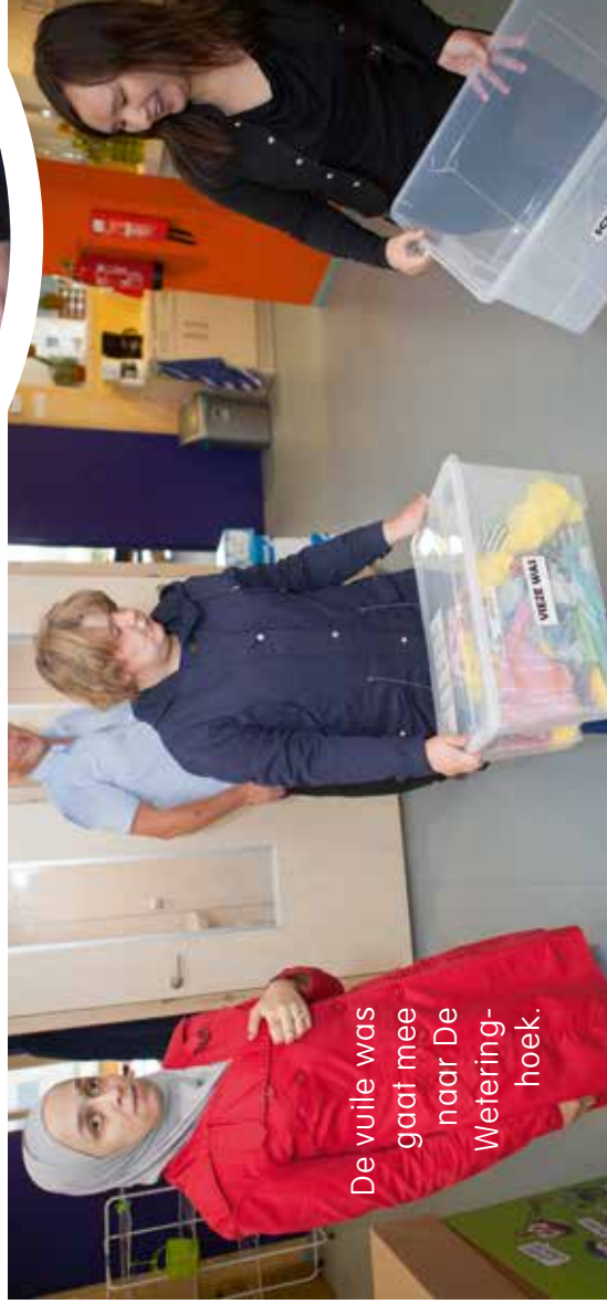
De vuile was gaat mee naar De Weteringhoek.