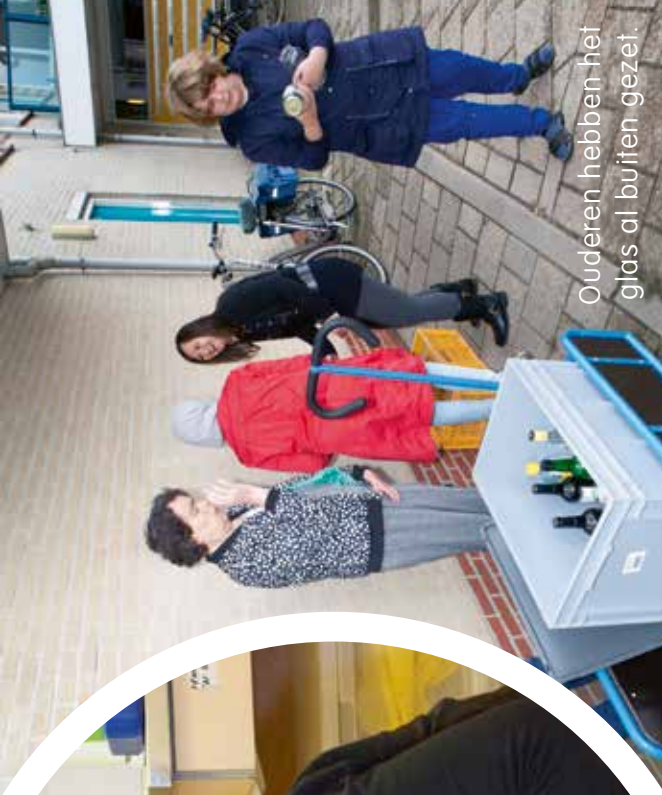
Ouderen hebben het glas al buiten gezet.