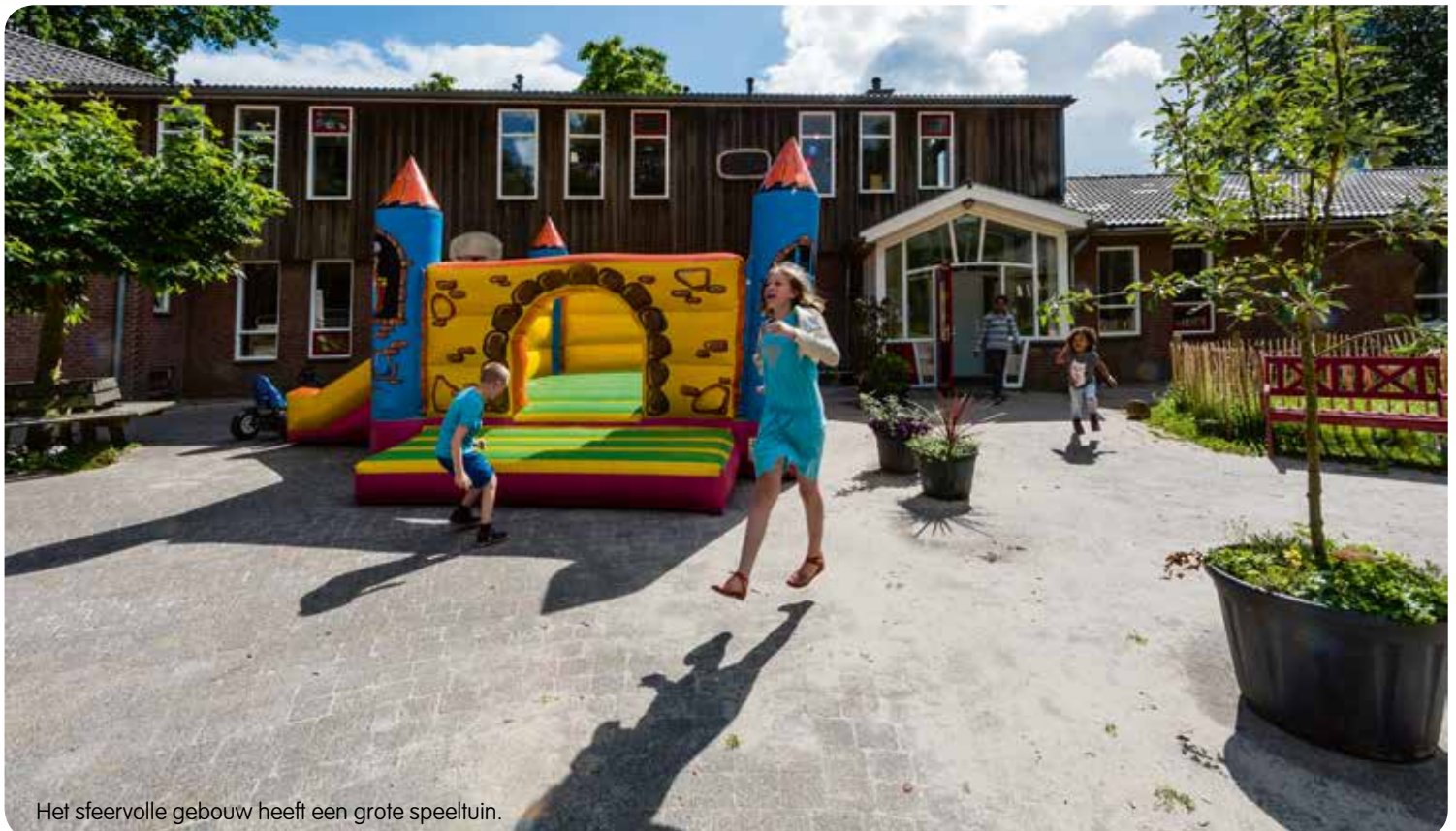
Het sfeervolle gebouw heeft een grote speeltuin.

Voor meer informatie over de nieuwe BSO in Zeist kun je bellen met Reinaerde Klantadvies: 030- 2875210, of mailen naar: klantadvies@reinaerde.nl ●