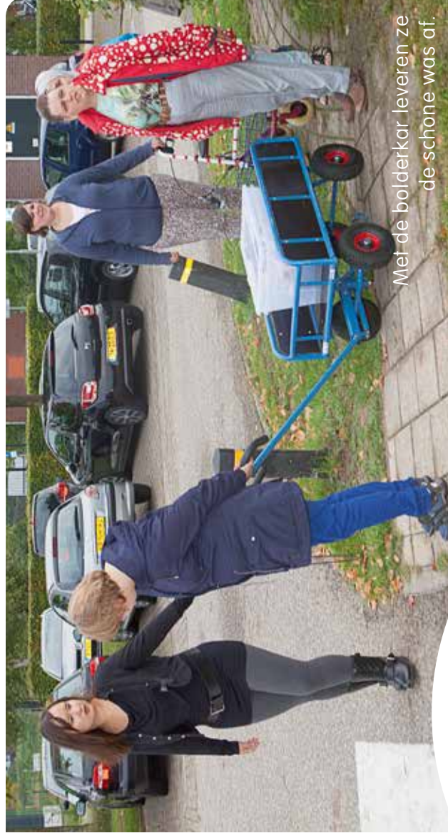
Met de bolderkar leveren ze de schone was af.