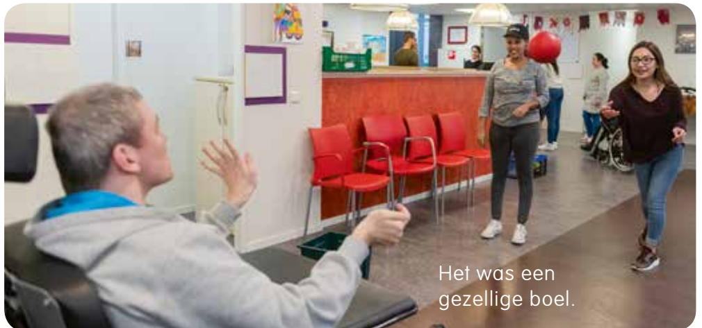
Het was een gezellige boel.

In de hal werden de leerlingen enthousiast opgewacht. Ze hielpen bij allerlei activiteiten. In het begin was dat nog een beetje spannend. Maar al snel werd het een