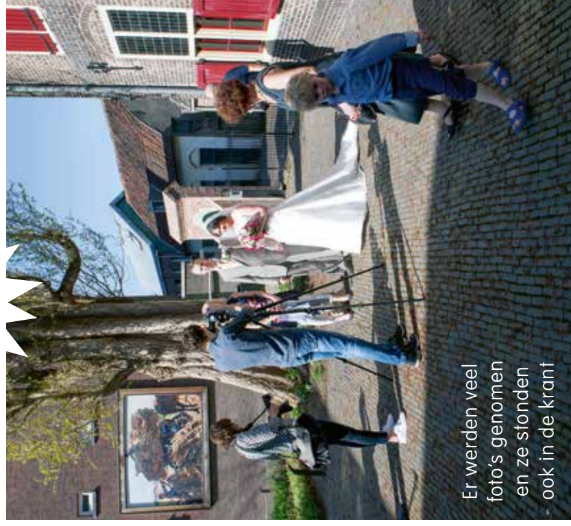
Er werden veel foto's genomen en ze stonden ook in de krant