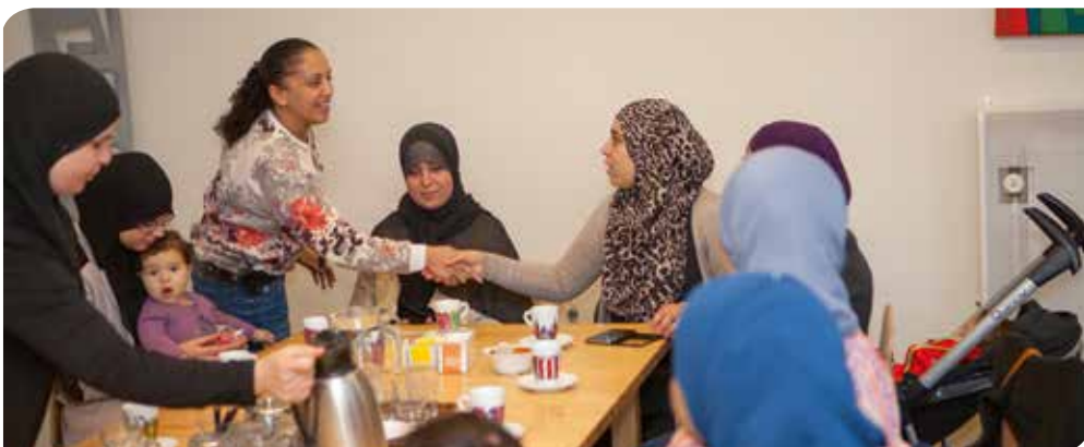
De moederdialogen worden altijd goed bezocht.

Al met al lijken de inloopochtenden een antwoord te zijn op de constatering dat er binnen de niet-westerse gemeenschap een substantiële groep mensen is die moeizaam aansluiting vindt bij de Nederlandse samenleving, aldus Schipper. De moederdialogen bieden wel die veilige plek waar aansluiting gevonden kan worden. "Continuering hiervan is dan ook zeer gewenst", besluit ze haar rapport. ●