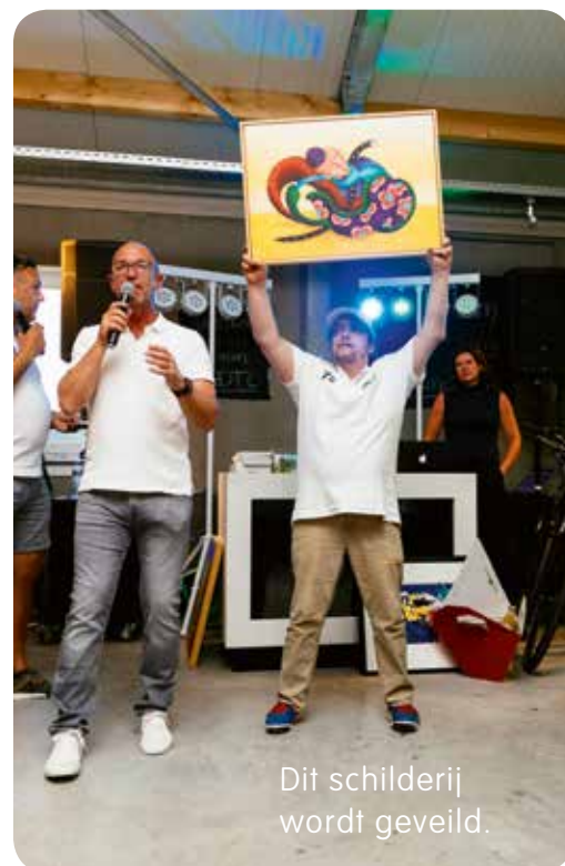
Dit schilderij wordt geveild.