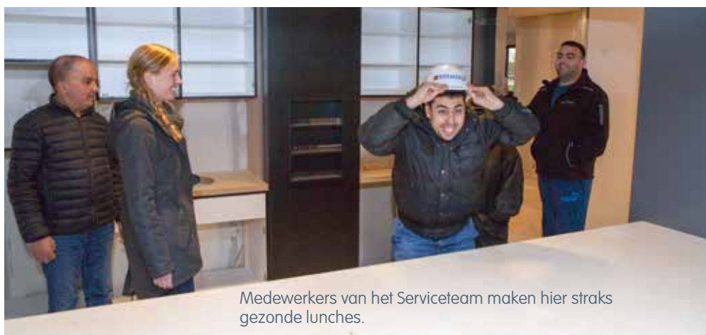
Medewerkers van het Serviceteam maken hier straks gezonde lunches.

Werken in netwerken wordt steeds belangrijker. We willen meer verbinden en samenwerken met cliënten, collega's, de buurt en gemeenten. Ook hebben we behoefte aan duurzame relaties en een goede werkomgeving. Daarom komen er Samenwerkplaatsen: nieuwe werkplekken met een open karakter. Hier kan je -naast prettig werken- ook cliënten en collega's ontmoeten. Ook die van zorgpartners.