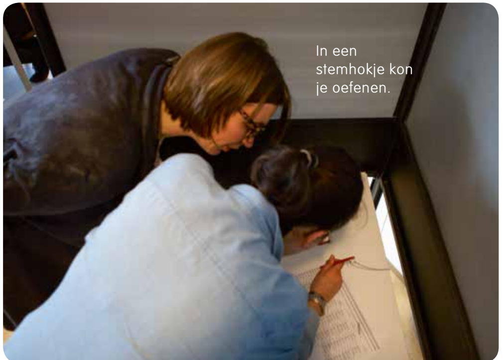
In een stemhokje kon je oefenen.