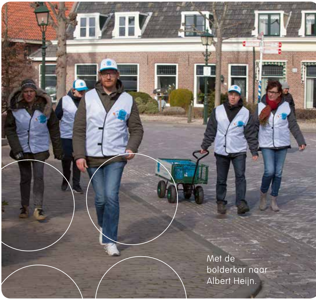
Met de bolderkar naar Albert Heijn.