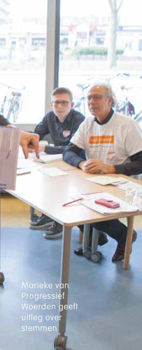
Marieke van Progressief Woerden geeft uitleg over stemmen.

Op 9 maart was er een politiek café in Woerden. Dat was speciaal voor mensen met een beperking. Je kon vragen stellen aan de burgemeester. Er waren ook gemeenteraadsleden. Zij vertelden wat gemeenteraadsverkiezingen zijn. Ze vertelden hoe je kunt stemmen. En op wie je kunt stemmen. Er was een stemhokje neergezet. Ook waren er lijsten met namen van kandidaten. Met een rood potlood kon je oefenen.