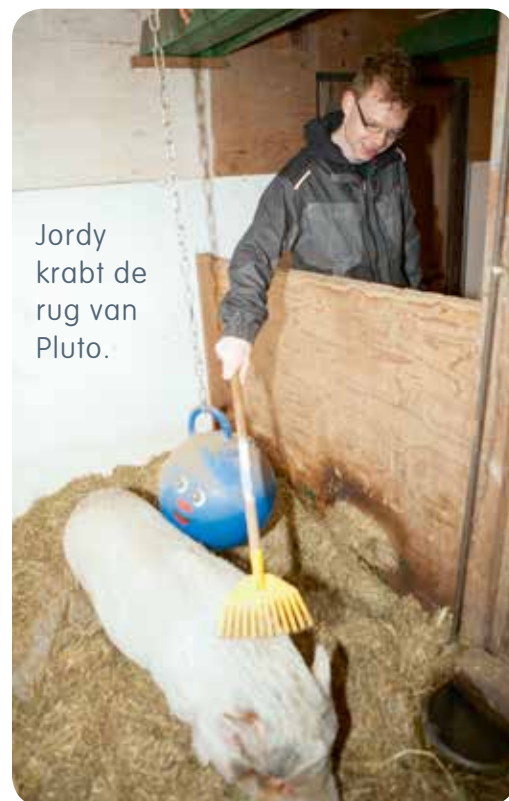
Jordy krabt de rug van Pluto.