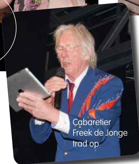
Cabaretier Freek de Jonge trad op