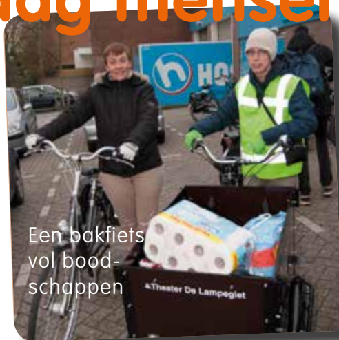
Een bakfiets vol boodschappen