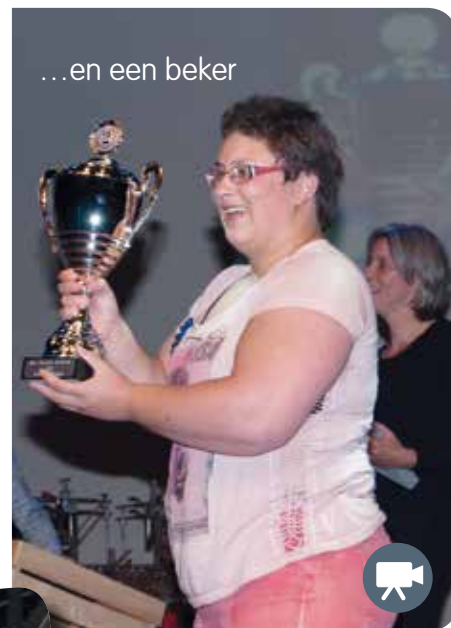
...en een beker