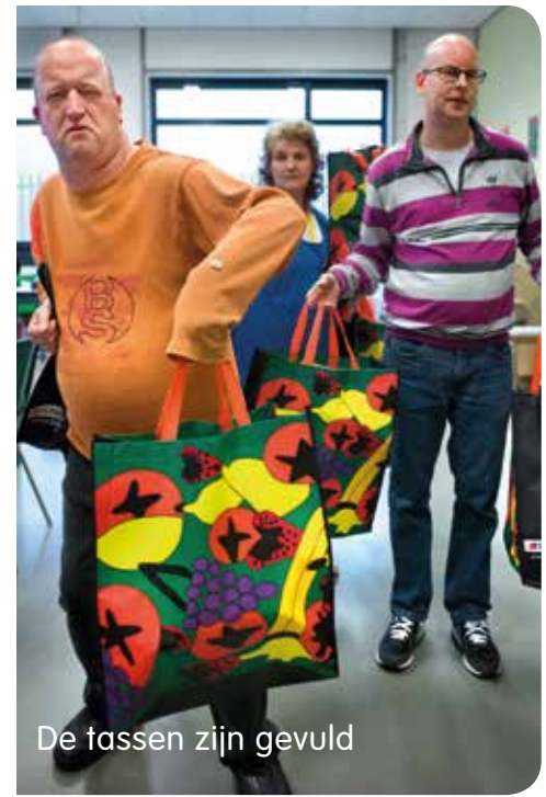
De tassen zijn gevuld