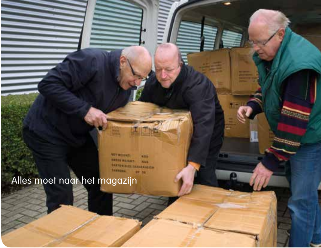
Alles moet naar het magazijn