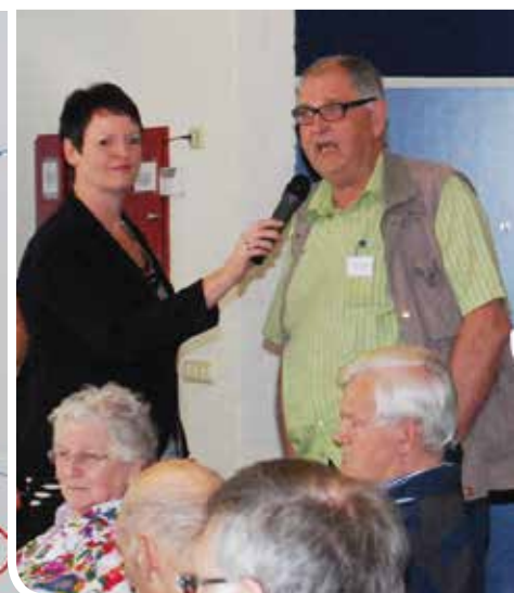
Familieleden van cliënten aan het woord