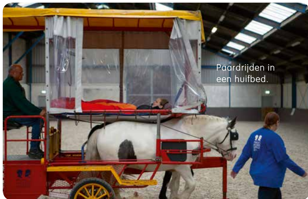
Paardrijden in een huifbed.