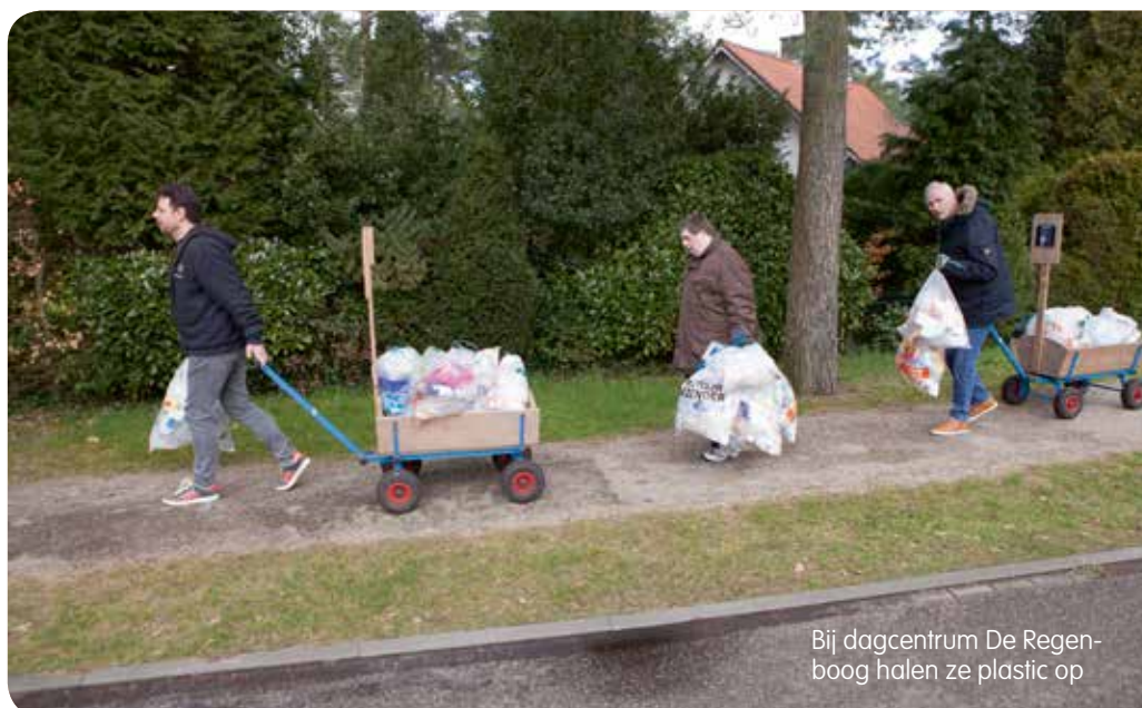
Bij dagcentrum De Regenboog halen ze plastic op