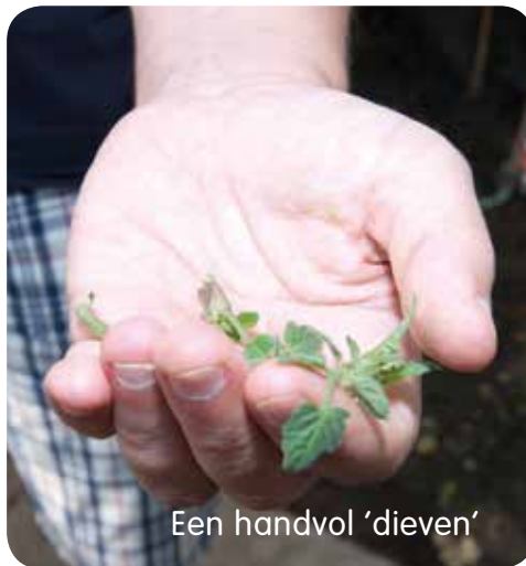
Een handvol 'dieven'

In de moestuin moet nog van alles worden gezaaid en geplant. De burens helpen graag een handje mee.